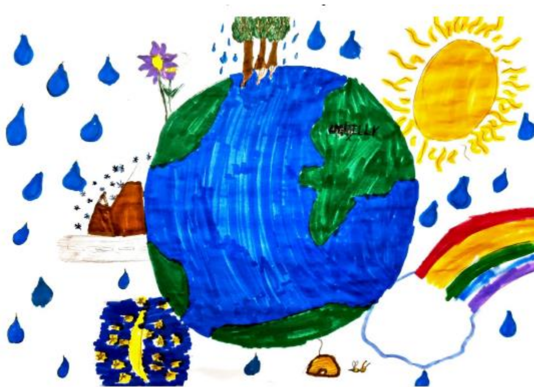
Dessin lauréat du concours

Les dessins reçus ont ensuite été triés en fonction du respect de la thématique et des contraintes techniques de reproduction du dessin. Des traits trop fins ou complexes ne permettent pas un rendu satisfaisant au sol par exemple. Une dizaine de dessins sur les 56 dessins reçus ont été sélectionnés.