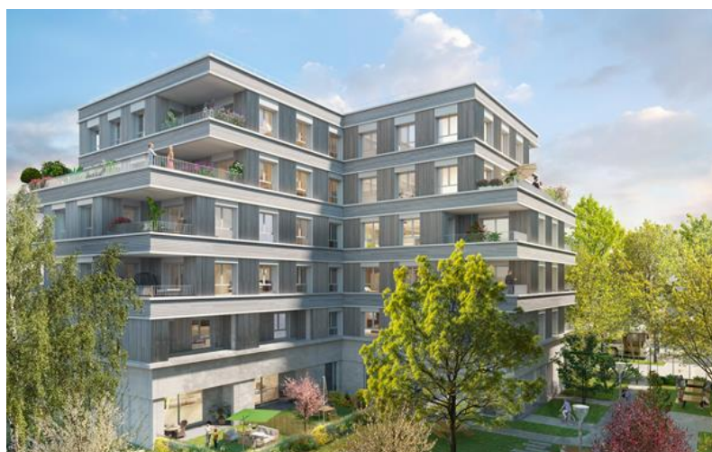
Lot C5-1 ©JBMN Architectes et SUB Architectes, Illustrateur : FAU

*Date prévisionnelle, hors cause légitime de retard ou cas de force majeure.