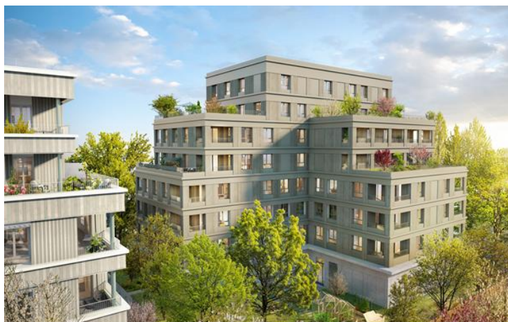
Lot C5-1 ©JBMN Architectes et SUB Architectes, Illustrateur : FAU

Les logements seront évolutifs pour permettre une meilleure appropriation par leurs résidents (cloisonnement flexible, pièces en plus) et chercheront à tirer parti des qualités du site paysager environnant, en créant des salons d'angle double orientés s'ouvrant sur des loggias et des terrasses généreuses.