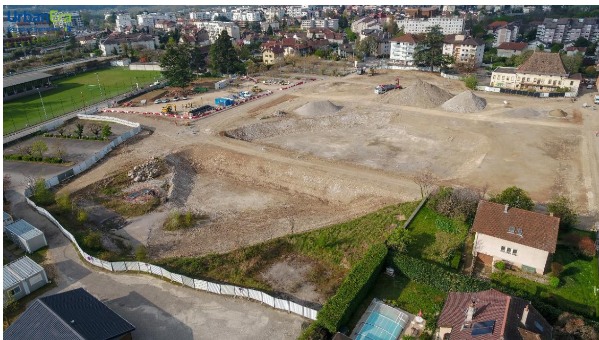
Travaux préparatoires du site (printemps 2021)

*Date prévisionnelle, hors cause légitime de retard ou cas de force majeure.