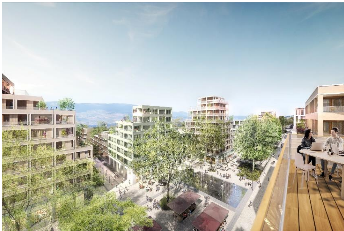
Place centrale vue du haut ©D&A architectes-urbanistes